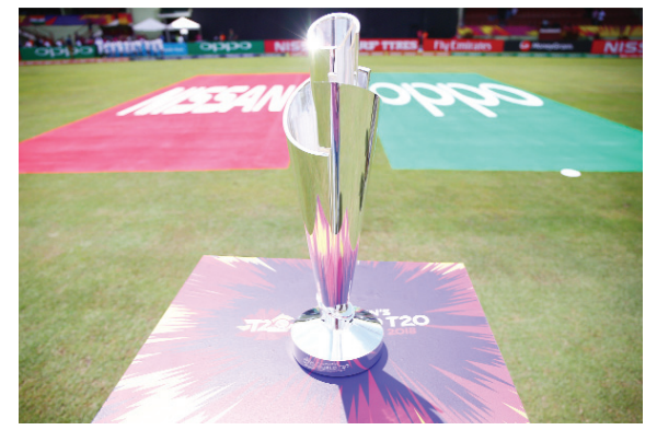
మహిళల టీ20 ప్రపంచవ్యాప్త రన్నరప్ గా నిలిచిన జట్టుకు ఇప్పుడు 1.7 మిలియన్ అమెరికన్ డాలర్లు అంటే రూ.14.24 కోట్లు ఇవ్వనున్నారు. గతంలో రన్నరప్ గా 4.18 కోట్లు దక్కింది. రన్నరప్ ప్రజల మనోహరమైన 134 శాతం పెరిగడం విశేషం. సెమిఫైనల్ లో ఓడిన జట్టుకు, గ్రూప్ దశలో నిష్క్రమించిన జట్టుకు సైతం ప్రజల మనోహరమైన ఐసీసీ పెంచింది.

ప్రపంచవ్యాప్త ప్రజల మనోహరమైన అంతర్జాతీయ క్రికెట్ మండలి మంగళవారం కీలక నిర్ణయం తీసుకున్నది. వచ్చే నెలలో యూఏఈ వేదికగా జరిగిన 20వ వుమెన్స్ ప్రపంచవ్యాప్త జరుగుతున్నది. ఈ క్రమంలో వుమెన్స్ క్రికెట్ లకు శుభవార్త చెప్పింది. ప్రపంచవ్యాప్త వుమెన్స్ క్రికెట్ లకు సమానంగా వుమెన్స్ క్రికెట్ లకు సైతం ప్రజల మనోహరమైన అంతర్జాతీయ క్రికెట్ మండలి దాదాపు 19.60 కోట్ల డాలర్లతో దక్షిణాఫ్రికా వేదికగా జరిగిన వుమెన్స్ టీ20 ప్రపంచవ్యాప్త క్రికెట్ జట్టుకు రూ.8.37 కోట్ల ప్రజల మనోహరమైన దక్కింది. ఈ విధాది అమెరికా, వెస్ట్ ఇండీస్ వేదికగా జరిగిన టీ20 వరల్డ్ కప్ గెలిచిన టీమిండియా మెన్స్ జట్టుకు రూ.23.40 కోట్ల అమెరికన్ డాలర్ల ప్రజల మనోహరమైన విషయం తెలిసింది. తాజాగా జరిగిన వుమెన్స్ టీ20 విజేతకు సైతం అంతే మొత్తంలో ప్రజల మనోహరమైనది. గతే దాడితో పోల్చిన ప్రజల మనోహరమైన 134 శాతం పెరిగినట్లు అవుతుంది. ఐసీసీ జూలై 2023లో జరిగిన ఐసీసీ వార్షిక సమావేశంలో ప్రజల మనోహరమైన నిర్ణయం తీసుకున్నది. ఐసీసీ తాజా నిర్ణయంతో క్రికెట్ వరల్డ్ కప్ మెన్స్, వుమెన్స్ జట్టుకు సమానంగా ప్రజల మనోహరమైన ఇచ్చే తొలి క్రీడగా క్రికెట్ నిలిచింది.