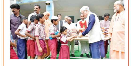
ఇక, జీవన్మృత వీసీ ప్రొఫెసర్ కాంతిశ్రీ పండిట్ మాట్లాడుతూ.. మహిళలు తమకున్న అవకాశాలను సద్వినియోగం చేసుకోవాలని సూచించారు.