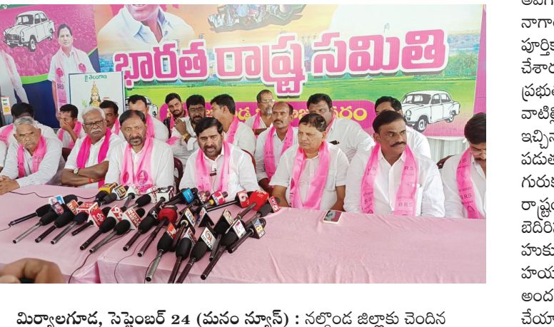
మిర్యాలగూడ, సెప్టెంబర్ 24 (మనం న్యూస్) : నల్గొండ జిల్లాకు చెందిన