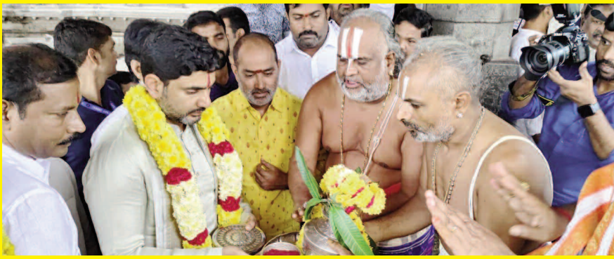
సింహాద్రి అప్పన్నను దర్శించుకున్న మంత్రి నారా లోకేష్