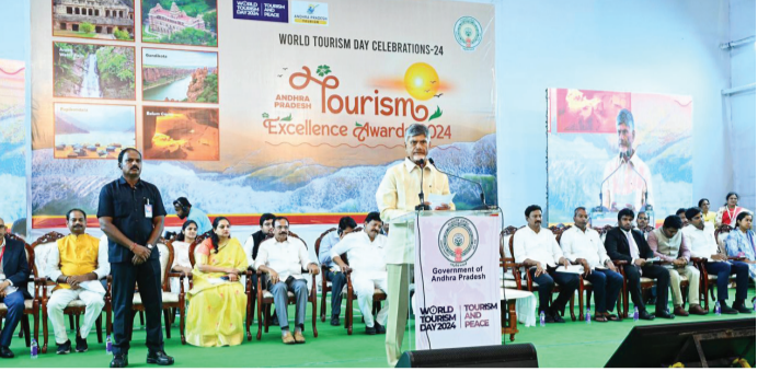
భవిష్యత్తులో ఏ దేవాలయాల్లో కూడా అపచారాలు లేకుండా చూసే బాధ్యత తీసుకుంటా" అని చంద్రబాబు అన్నారు.