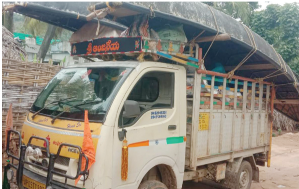
భాగంగా విలువైన మత్స్య సంపద కొల్లగొట్టుకొని పోతున్న దోపిడీదారులను పట్టుకున్నారని చీరమేను అలిపి వేట వలల వేట, తెప్పలు, బోట్లు తో, వేటగాళ్ల నుండి మూడు శాఖల అధికారులు అడుగుతూ తీసుకున్నారు. ఓవైపు వేట నిషేధం లో ఉండగా వలలతో దొరికిన మత్స్యసంపదను తీసి చేయలేదు సరి కదా ఏ ఒక్కరి పైన క్రిమినల్ చర్యలు తీసుకోలేదు.