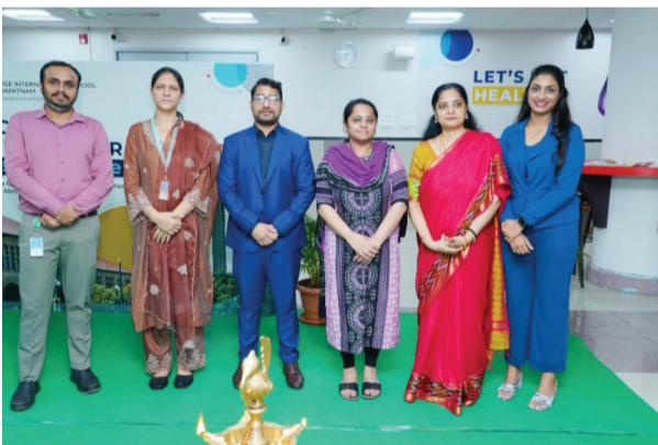
తెలుసుకోగలిగారు. అదనంగా, యూనివర్సిటీ దరఖాస్తు చేయడానికి అవసరమైన సూచనలు కూడా పొందగలిగారు. ఈ సందర్భంగా ఒకటి ఇంటర్నేషనల్ సూల్స్ ట్రైనింగ్ సెల భవిషివేటి మాట్లాడుతూ, ఈ యూనివర్సిటీ ఫెయర్ ద్వారా విద్యార్థులకు ఉన్నత విద్యకు

తగవరపువలస, సెప్టెంబర్ 27 (మనం న్యూస్) : ఇప్పటి కాలంలో విద్యార్థులకు ఎన్నో కెరీర్ అవకాశాలు ఉన్నాయి. గ్లోబల్ యూనివర్సిటీ ఫెయర్ కు వెళ్లడం ద్వారా వారు వివిధ కోర్సులు, అవకాశాలు తెలుసుకొని, సరైన దారిని ఎంచుకోవడానికి సహాయపడుతుంది. అటువంటి గ్లోబల్ యూనివర్సిటీ ఫెయర్ శుక్రవారం ఓక్రిడ్డ్ ఇంటర్నేషనల్ పాఠశాల లో నిర్వహించారు. అమెరికా, బ్రిటన్, ఇండీయా, చైనా, ఆస్ట్రేలియా, యూరప్, సింగపూర్, కెనడా వంటి దేశాలలో ఉన్న 60కి పైగా ప్రఖ్యాత యూనివర్సిటీల ప్రతినిధులు ఈ ఫెయర్ పాల్గొన్నారు. 500 మందికి పైగా విద్యార్థులు, తల్లిదండ్రులు విశాఖపట్నం నుండి ఈ కార్యక్రమానికి హాజరయ్యారు. ఈ ఫెయర్ ద్వారా విద్యార్థులు యూనివర్సిటీ ప్రతినిధులతో మాట్లాడి, కొత్త-కెరీర్ అవకాశాలు, అడ్మిషన్ వివరాలు, స్కాలర్షిప్ అవకాశాల గురించి