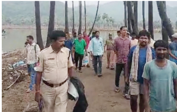
జరుగుతున్న చిన్న చేపల స్వర్గింగ్ వ్యవహారం మొదటి ఉన్న పెద్ద పుక్కులు ఎవరనేది అధికారులకే తెలియాలి ఉంది.