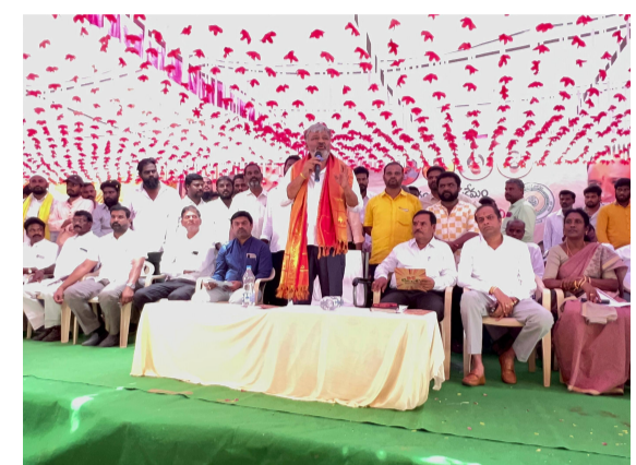
దేశస్థాయిలో ప్రశంసలందుకున్న ముఖ్యమంత్రి నారా చంద్రబాబు నాయుడు