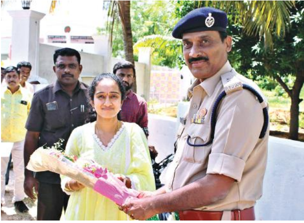
పుట్టపర్తి సెప్టెంబర్ 17 మనంస్వయం : పుట్టపర్తి ఎమ్మెల్యే పల్లె సింధూర రెడ్డిని మంగళవారం ఎమ్మెల్యే క్యాంపు కార్యాలయంలో అడిషనల్ ఎస్సీ శ్రీనివాసులు మర్యాద పూర్వకంగా కలసి పుష్ప గుచ్ఛం అందజేశారు.