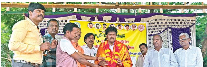
మడకశిర, సెప్టెంబర్ 24, మనసాహారం: