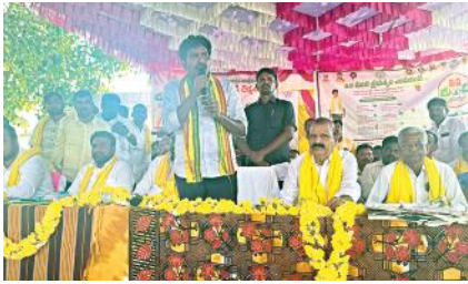
గుడిబండ (మడకశిర), సెప్టెంబర్ 24, మనసాహారం: