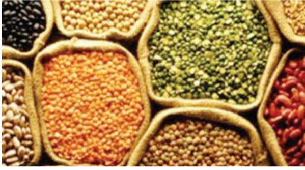
టూంది ఈ విధంగా ఎక్సైజ్ సుంకం పెంచడం వల్ల కూడా ధరలు విపరీతంగా పెరిగాయి.

నల్లగొండ, అక్టోబర్ 04 (మనం ప్రతినది): దసరా పండగ వస్తూ ఉండడంతో తో నిత్యవసర వస్తువుల ధరలతో పాటు కూరగాయల ధరలు అత్యధికంగా పెరిగిన చికెన్, మటన్ ధరలు విపరీతంగా పెరగడంతో పాటు బట్టల ధరలు కూడా విపరీతంగా పెరిగాయి. పేద మధ్యతరగతి ప్రజలు పండగ చేసుకోవాలంటే ప్రస్తుతం ఇబ్బందిగానే మారింది. రోజురోజుకూ ధరలు పెరుగుతూ ఉండడంతో ప్రజలు ఆందోళన చెందుతున్నారు. దసరా పండుగకు 20 రోజుల ముందుగానే ప్రజలపై ధరల పెరుగుదల ప్రభావం పడింది. అన్ని రకాల వస్తువుల ధరలు ఒకసారిగా పెరిగిపోయాయి. ప్రస్తుతం దసరాలో సాధారణంగా ఎవరైనా ఎక్కువగానే పంటనూనె ఉపయోగిస్తారు. ఎందుకంటే పిండి వంటలు అధికంగా చేసి అవకాశం ఉంటుంది. కాబట్టి అధికంగా ఉపయోగిస్తారు ప్యాకెట్ కు ఒక కిలో 150 వరకు ఉన్నది. పామ్ ఆయిల్ లీటర్ కు 140 నుండి 150 వరకు ధర పలుకుతూ ఉన్నది. చెప్పాల్సిన అవసరం లేకుండా ధరలు పెరిగాయి. పేద మధ్య తరగతి ప్రజలు కూడా తప్పనిసరిగా దసరా పండుగ ముందు పిండి పదార్థాలు తయారు చేసుకుంటారు. ధరలు విపరీతంగా పెరగడంతో తమ ఇంట్లో వారు ఆందోళనకు గురవుతున్నారు. కేంద్ర ప్రభుత్వం నూనె ధరలపై ఎక్సైజ్ సుంకం 1.2 నుండి 3.2 శాతానికి పెంచడంతో ధరలు ఒకసారిగా పెరిగాయి. ఏ కూర చేయాలన్న పిండి వంటలు చేయాలన్న నూనె తప్పనిసరిగా వాడల్సి ఉంది.