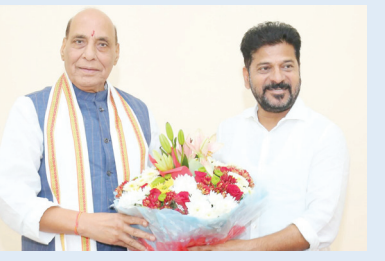
సీఎం రేవంత్ ఘనంగా స్వాగతం పలికారు. హైదరాబాద్ దేశ రక్షణకు సంబంధించి కీలకమైన కార్యక్రమం. తెలంగాణకు మూడు వైపులా సముద్రం ఉంది. ఇక్కడ వీఎల్ఎఫ్ నిర్మాణంతో సముద్ర ప్రాంతం నుంచి చొరబడే ముప్పులు నుంచి రక్షణ లభిస్తుంది. ఈ స్టేషన్తో అసర్వాల జరుగుతాయని కొందరు అపోహలు కలిగించే ప్రయత్నం చేశారు. కానీ తమిళనాడులో 34 ఏళ్లగా