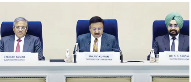
అక్టోబర్ 25తో నామినేషన్ గడువు ముగుస్తుంది. అక్టోబర్ 28న నామినేషన్ పరిశీలన జరుగుతుంది. అక్టోబర్ 30తో నామినేషన్ ఉపసంహరణ గడువు ముగుస్తుంది. తొలి విధతలో భాగంగా 43 నియోజకవర్గాలకు నవంబర్ 13న పోలింగ్ జరుగుతుంది. రెండో విధత నోటిఫికేషన్ అక్టోబర్ 22న వెలువడుతుంది. అక్టోబర్ 29తో నామినేషన్ గడువు ముగుస్తుంది. అక్టోబర్ 30న నామినేషన్ పరిశీలన జరుగుతుంది. నామినేషన్ ఉపసంహరణ గడువు నవంబర్ 1వ తేదీతో ముగుస్తుంది. నవంబర్ 20న రెండో విధత పోలింగ్ జరుగుతుంది. నవంబర్ 23న కౌంటింగ్ జరిపి ఫలితాలు ప్రకటిస్తారు. కాగా, 288 మంది సభ్యులను మహారాష్ట్ర అసెంబ్లీ గడువు నవంబర్ 26తో ముగిస్తోంది. ఈలోపు ఎన్నికలు నిర్వహించాలి ఉంటుంది. 81 స్థానాలను జార్ఖండ్ అసెంబ్లీ గడువు వచ్చే ఏడాది జనవరి 1వ తేదీతో ముగిస్తుంది. మహారాష్ట్రలో బిజీ, శివసేన, ఎన్.డి.ఎ.తో కూడిన మహాకూటమి ప్రభుత్వం అధికారంలో ఉండగా, జార్ఖండ్ లో బి.జే.పి. అధికారంలో ఉంది. అలాగే ఉత్తరప్రదేశ్ లో 9 అసెంబ్లీ స్థానాలకు ఉప ఎన్నికలు తేదీని కూడా ఎన్నికల కమిషన్ మంగళవారంనాడు ప్రకటించింది. నవంబర్ 13న పోలింగ్ జరుగుతుండగా, నవంబర్ 23న ఫలితాలు ప్రకటిస్తారు. మహారాష్ట్ర, జార్ఖండ్ అసెంబ్లీ ఎన్నికల షెడ్యూల్ ప్రకటించే సమయంలోనూ ఇదే ప్రక్రియ అధిగతే మళ్ళీ మళ్ళీ ఇదే సమయానికి సమిస్తామన్నారు.

న్యూఢిల్లీ, అక్టోబర్ 15 (మనం న్యూస్): మహారాష్ట్ర, జార్ఖండ్ లో ఎన్నికల షెడ్యూల్ ను కేంద్ర ఎన్నికల సంఘం ప్రకటించింది. మహారాష్ట్రలో నవంబర్ 20న ఒకే విధతలో పోలింగ్ జరుగుతున్నట్లు సీఈసీ రాజీవ్ కుమార్ ప్రకటించారు. నవంబర్ 23న ఫలితాలు ప్రకటిస్తారు. గెజిట్ నోటిఫికేషన్ అక్టోబర్ 22న వెలువడనుంది. నామినేషన్ గడువు అక్టోబర్ 29వ తేదీతో ముగుస్తుంది. నామినేషన్ పరిశీలన అక్టోబర్ 30న జరుగుతుంది. నామినేషన్ ఉపసంహరణ గడువు నవంబర్ 4వ తేదీతో ముగుస్తుంది. నవంబర్ 25వ తేదీకిగా ఎన్నికలు ముగియాలి ఉంటుంది. జార్ఖండ్ లోనూ ఎన్నికల రెండు విధాలుగా జరుగుతున్నట్లు సీఈసీ ప్రకటించారు. తొలి విధత నవంబర్ 13, రెండో విధత నవంబర్ 20న జరుగుతుంది. తొలి విధత ఎన్నికలకు అక్టోబర్ 18న నోటిఫికేషన్ వెలువడుతుంది.