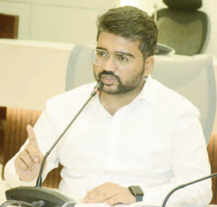
అధికారులు, తనిఖీ సిబ్బందితో ప్రత్యేకంగా సమావేశమయ్యారు. రేషన్ సరుకుల పంపిణీ, దుకాణాల నిర్వహణ, ఎండియూ వాహనాల ద్వారా రేషన్ అందజేత, తనిఖీలు, కేసుల నమోదు తదితర అంశాలపై

విశాఖపట్టణం, అక్టోబర్ 25 మనం న్యూస్ : రేషన్ దుకాణాల్లో, ఎం.ఎల్.ఎస్. (నిల్వ కేంద్రాలు) పాయింట్లలో విస్తృత తనిఖీలు చేపట్టాలని అవకతలకు పాల్పడిన వారిపై 6వ కేసులు నమోదు చేయాలని పౌర సరఫరాల శాఖ అధికారులను, తనిఖీ సిబ్బందిని జాయింట్ కలెక్టర్ కె. మయూర్ అశోక్ ఆదేశించారు. రేషన్ సరుకులు దుర్వినియోగం కాకుండా చూడాలని, దారి మళ్లించే వారిపై గట్టి నిఘా ఉంచాలని సూచించారు. నిబంధనలకు విరుద్ధంగా వ్యవహరించే వారిపై క్రిమినల్ చర్యలకు ఉపక్రమించాలని పేర్కొన్నారు. కలెక్టరేట్ మీటింగు హాల్లో శుక్రవారం ఉదయం ఆయన పౌర సరఫరాల శాఖ జిల్లా