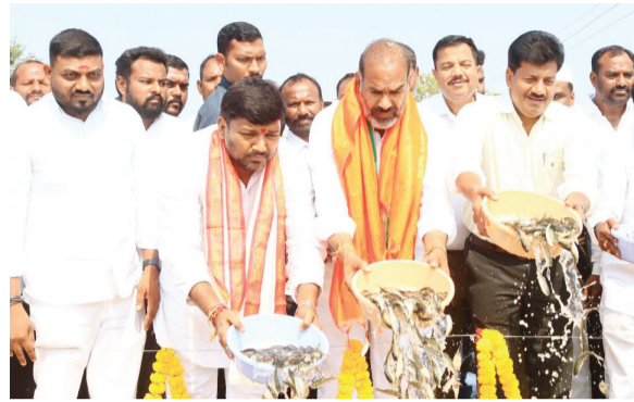
కార్యక్రమాన్ని చేపడుతున్నట్లు తెలిపారు. చేపలను తినడం వల్ల ఆరోగ్యానికి ఎంతో మేలు జరుగుతుందని తెలిపారు. చేపల వేటకు వెళ్లి ప్రమాద

వేములవాడ, అక్టోబర్ 27 (మనం న్యూస్): మత్స్యకారుల కుటుంబాల ఆర్థిక అభ్యున్నతే కాంగ్రెస్ ప్రభుత్వ లక్ష్యమని ప్రభుత్వ ఎమ్, వేములవాడ ఎమ్మెల్యే ఆది శ్రీనివాస్ తెలిపారు. ఆదివారం మత్స్య శాఖ అధ్యక్షులలో మిడ్ మానేరు పరిధిలోని వేములవాడ అర్బన్ మండలం గ్రుప్స రంలో ఉచితంగా 80 వేల చేప పిల్లల పంపిణీ కార్యక్రమానికి ప్రభుత్వ ఎమ్ వేములవాడ ఎమ్మెల్యే ఆది శ్రీనివాస్ శ్రీకారం చుట్టారు. ముఖ్యమంత్రి రేవంత్ రెడ్డి మత్స్యకారులకు 100% సబ్సిడీతో ఉచిత చేప విడుదలను పంపిణీ చేసే కార్యక్రమాన్ని యజ్ఞంల నిర్వహిస్తున్నారని తెలిపారు. అక్టోబర్ 4న మంత్రివర్గం పాస్చం ప్రభాకర్ ఎల్ఎండిలో చేప పిల్లల్ని విడుదల చేశారని గుర్తు చేశారు. రాష్ట్రవ్యాప్తంగా 53 కోట్ల చేప పిల్లల విడుదల