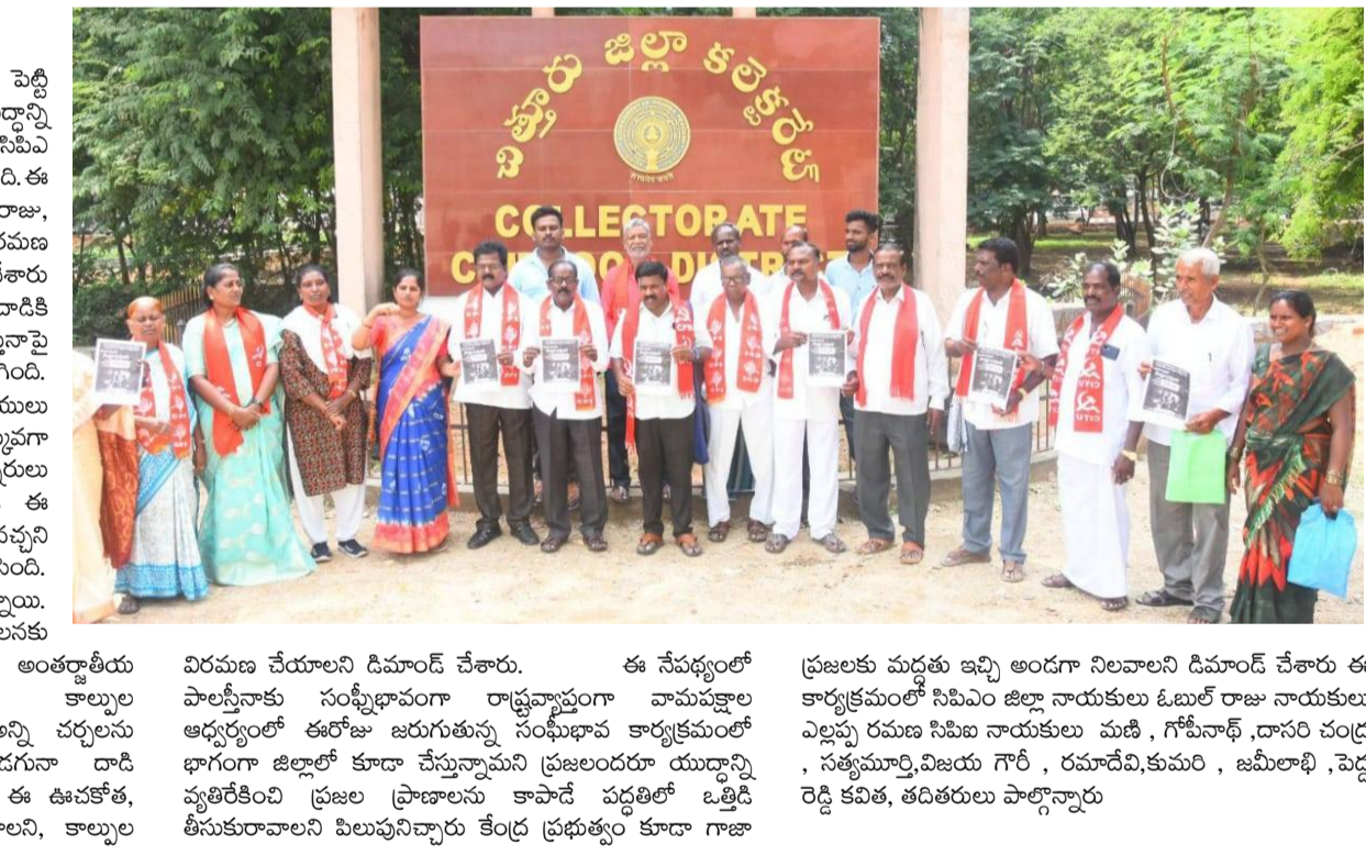
విరమణ చేయాలని డిమాండ్ చేశారు. ఈ నేపథ్యంలో పాలస్తీనాకు సంబంధించి రాష్ట్రవ్యాప్తంగా వామపక్షాల ఆధ్వర్యంలో కరోజు జరుగుతున్న సంఘభావ కార్యక్రమంలో భాగంగా జిల్లాలో కూడా చేస్తున్నామని ప్రజలందరూ యుద్ధాన్ని వ్యతిరేకించి ప్రజల ప్రాణాలను కాపాడే వద్దతిలో ఒడ్టి తీసుకురావాలని పిలుపునిచ్చారు కేంద్ర ప్రభుత్వం కూడా గాజు