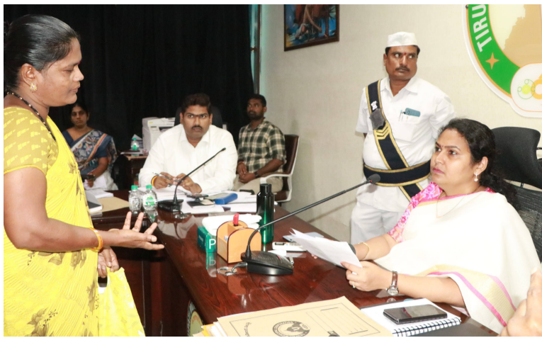
ఏర్పాటు చేయాలని ప్రధానాధికారులు కోరారు. డి.డి.ఆర్ బాండ్లు ఇప్పించాలని, ద్రైనేజీ శుభ్రం చేయించాలని కొంత

ప్రజల సమస్యలను పరిష్కరించడమే తమ ధ్యేయమని, ఆ దిశగా అధికారులు పనిచేయాలని నగరపాలక సంస్థ కమిషనర్ ఎస్.హార్ష అధికారులను ఆదేశించారు. సోమవారం నగరపాలక సంస్థ కార్యాలయంలో ప్రజా పిన్యాసుల పరిష్కార వేదిక కార్యక్రమం నిర్వహించారు. ఈ పరిష్కార వేదిక కార్యక్రమంలో ప్రజల నుండి 43 వివరాలు వచ్చాయి. తమ ఇంటి పై చెట్టు పడే అవకాశం ఉందని తొలగించాలని క్రాంతి నగర్ కు చెందిన మహిళ కోరారు. తెట్టిపల్లి లోని కొన్ని వీధుల్లో విద్యుత్ దీపాలు ఏర్పాటు చేయాలని, ద్రైనేజీ కాలువలు శుభ్రం చేయించాలని, రోడ్డు ఏర్పాటు చేయాలని కోరారు. పవర్ లైన్ మరమ్మత్తు చేయాలని ఉప్పుపాలెం ప్రజలు కోరారు. ఐఎస్ మహల్ వెంకట భాగంలో ఎక్కువగా చెత్త వేస్తున్నారని, శుభ్రం చేయించాలని నెట్టూ నగర్ వాసులు కోరారు. తమిళనాడునుండి సూరే వద్ద పడిపోయాల్సిన ఉన్న చెట్టు తొలగించాలని, త్రాగునీటి పైప్ లైన్