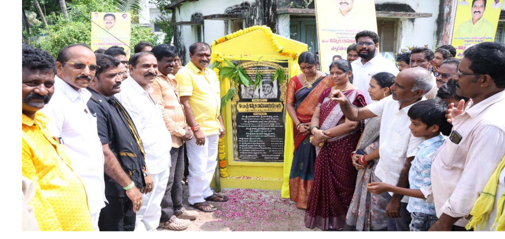
పాలకొల్లు, అక్టోబర్ 27, మనం ప్రతినిధి: ఆదివారం పాలకొల్లు మండలం ఆగర్ల పాలెం, ఆగర్ల గ్రామాల్లో రూ 1 కోటి 13 లక్షల విలువైన అభివృద్ధి పనులకు శంకుస్థాపన చేశారు. ముందుగా మంత్రికి