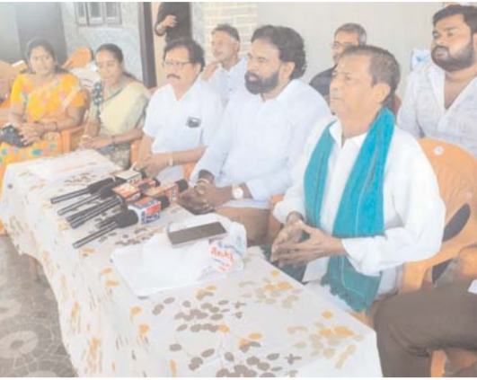
కాట్రేనికోసం అక్టోబర్ 27 మనం స్వాస్థ్యం రాష్ట్రంలో కూటమి ప్రభుత్వం అధికారంలోకి రావడానికి నూరుశాతం కృషి చేసిన కాపులకు సంపూర్ణ న్యాయం చేయడానికి ప్రభుత్వం కృషి