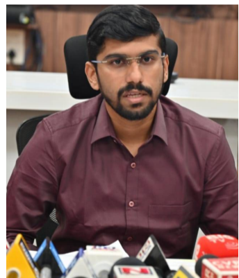
జిల్లాలో ఆయా నియోజకవర్గాలలో జిల్లాలో మంత్రులు శాసనసభ్యులు, పంపిణీ చేసారని ఆయన చెప్పారు.