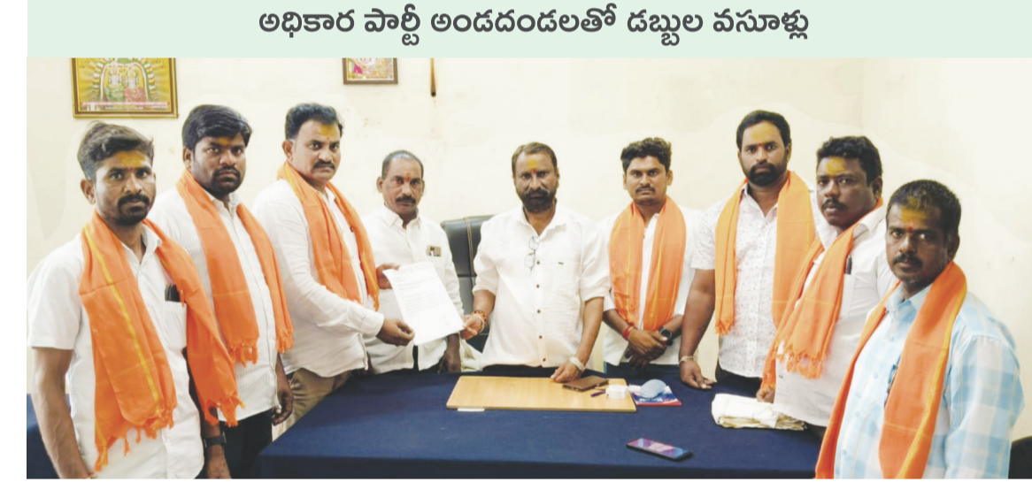
అలయ అధికారులు భూములను వ్యక్తం చేశారు. మల్లన్న ఆలయం ప్రస్తుతం ఉన్న పట్టింపుకోకుండా వ్యవహరిస్తున్నారని ఆవేదన ఈ. రిటైర్మెంట్ కు దగ్గర ఉండడంతో ఇన్వెస్ట్