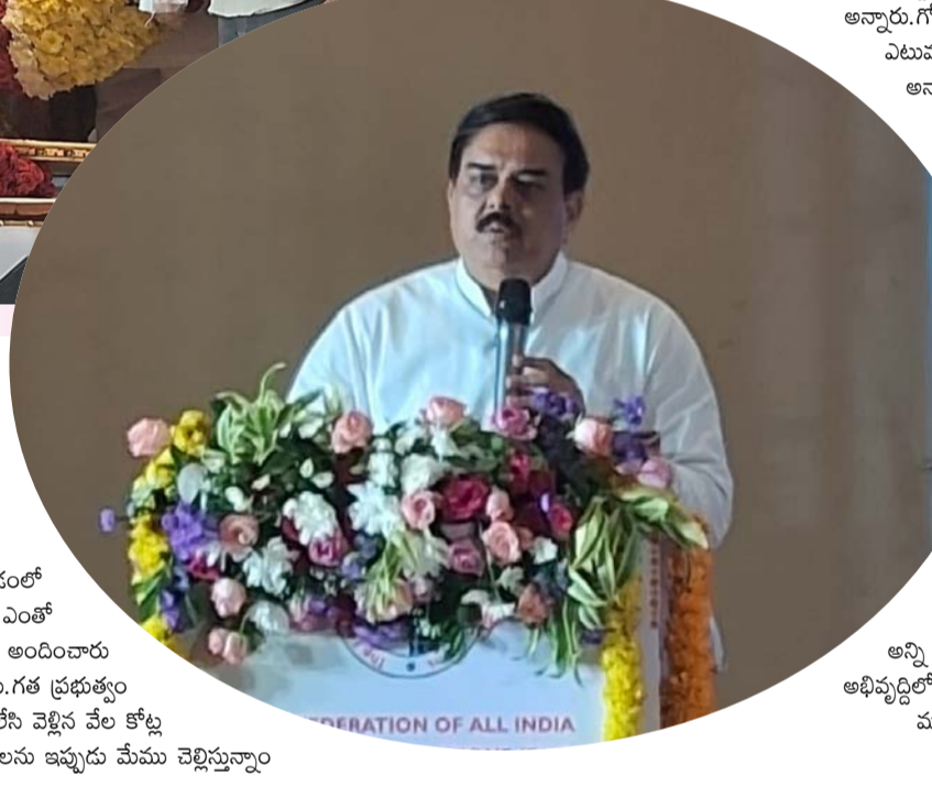
అందినదంలో మిల్లర్లు ఎంతో సహకారం అందించారు అన్నారు. గత ప్రభుత్వం పదిలన వెళ్లిన వేల కోట్ల బకాయిలను ఇప్పుడు మేము చెల్లిస్తున్నాం

ప్రారంభం ఆయ్యే లోపే 283 కోట్ల బకాయిలు చెల్లించాం.. మరో వారం రోజుల్లో 200కోట్లు చెల్లిస్తాం అన్నారు. కష్టపడి పండించిన ధాన్యం వారికి నచ్చిన చోట అమ్ముకునే స్వేచ్ఛ రైతులకు కల్పించాం అని తెలిపారు. మూడు జిల్లాల్లో ధాన్యం కొనుగోలు చేసిన 24 గంటలు 90 శాతం మందికి... మరో 10 శాతం మందికి ధాన్యం కొనుగోలుకు సంబంధించి డబ్బులు జమ చేసాం అన్నారు రైతులు, మిల్లర్లు, రాష్ట్ర ప్రభుత్వం నుంచి ప్రతినిధులను ఏర్పాటు చేసి పౌరసరఫరకంగా ఉండేలా కమిటీని ఏర్పాటు చేస్తున్నాంకూటమి ప్రభుత్వంలో ప్రధానంగా కాదు.. అండగా ఉండాలనేదే మా లక్ష్యం అని చెప్పారు. నాణ్యమైన బియ్యం సరఫరా చేయాలనే ఆలోచన చేస్తున్నాం అన్నారు. ఇటీవల నిత్యావసరం పన్నుల ధరలు కూడా బాగా పెరిగిపోయాయి ప్రజలకు ధరలు తగ్గించి ఇచ్చేలా అవసరమైన చర్యలు తీసుకున్నాంవరల సమయంలో బాధితులకు 25కోటి బియ్యం