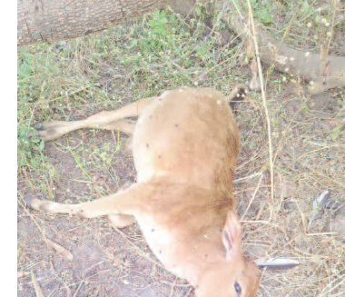
వ్యాధి నిర్ధారణ లేక, చికిత్స లేని పరిస్థితి