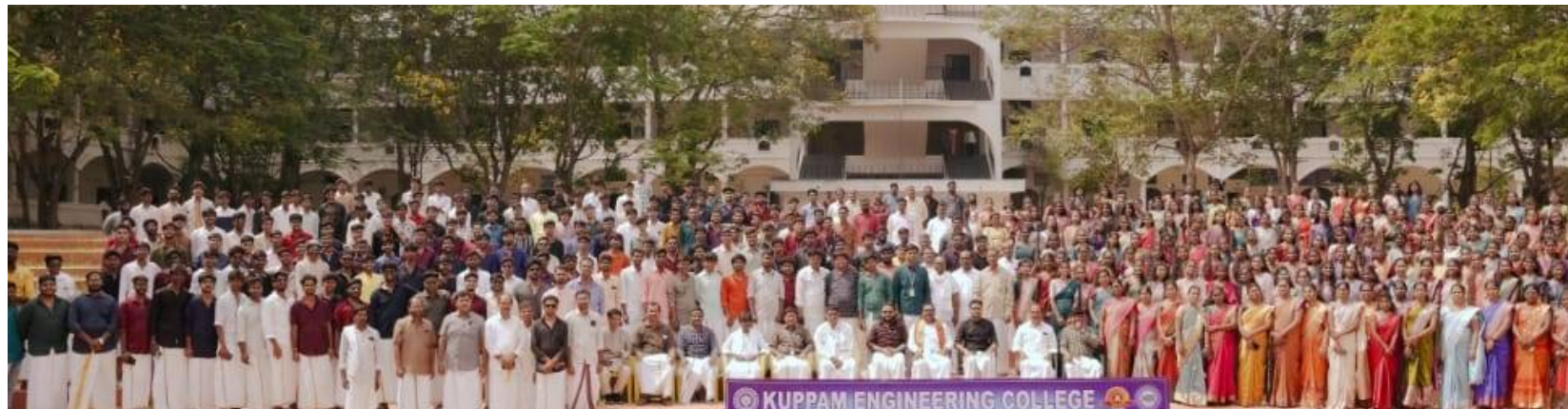
కుప్పం ఇంజనీరింగ్ కాలేజీలో