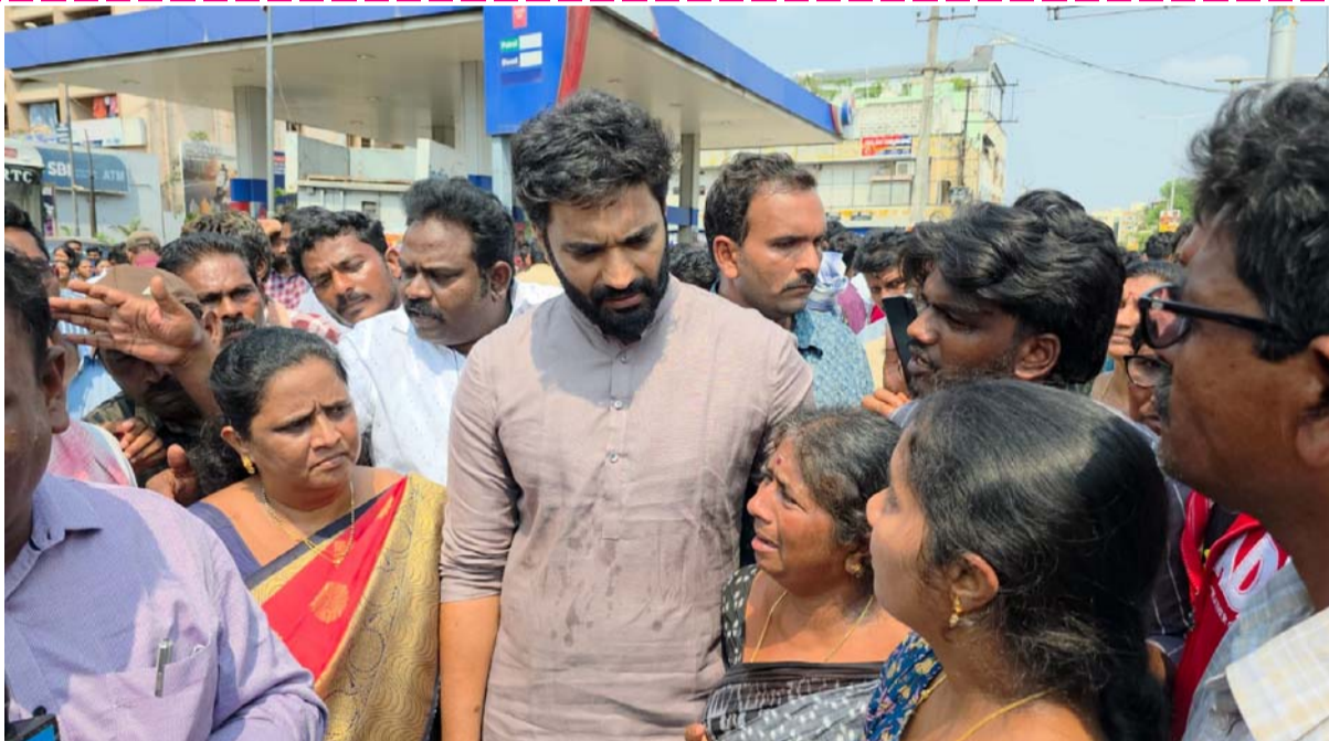
బొల్లినేని హాస్పిటల్ యాజమాన్యానికి వ్యతిరేకంగా పెట్టిన జంక్షన్ లో విద్యార్థులు నిరసన, మానవహారం