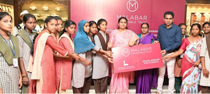
కమిషనర్ అభినందించారు. ప్రతి బాలిక చదువు కోవాలని అన్నారు. తన కాళ్ళ మీద తన నిలబడాలని అన్నారు. ఈ ఏడాది భారతదేశ వాస్తంగా 21,000 మంది బాలికల విద్యకు మద్దతుగా 16 కోట్ల రూపాయలను కేటాయించారు. ఆంధ్ర రాష్ట్రంలోని 142 కళాశాలల్లో చదువుతున్న 1,928 మంది బాలికల విద్యకు మద్దతుగా ఆంధ్ర రాష్ట్రంలో ఈ స్కాలర్షిప్ కార్యక్రమానికి గాను రూ. 1.67 కోట్లు కేటాయించింది. వీరిలో షోరూంకు చెందిన విద్యార్థులకు స్కాలర్షిప్ లు ప్రభుత్వస్థానియర్ కళాశాల లో అందుకున్నారు. మలబార్ గ్రూప్ ప్రారంభించినవది నుండి, తమ సామాజిక సంక్షేమ కార్యక్రమాల ద్వారా దాక్షా సమితి వృద్ధికి బలమైన నిబద్ధతను ప్రదర్శించింది. ఈ ప్రయత్నాలను