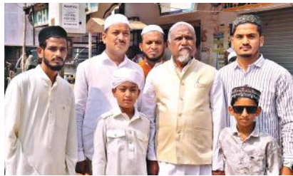
హిందూపురం టౌన్ మార్చి 31 (మనం న్యూస్):

హిందూపురం పట్టణంలోని ఆల్ హీలాల్ మైదానంలో రంజాన్ ప్రార్థనలు భక్తి శ్రద్ధలతో ఘనంగా జరిగాయి. ముస్లింలు ప్రార్థనలలో పెద్ద ఎత్తున పాల్గొని రంజాన్ శుభాకాంక్షలు ఒకరికి